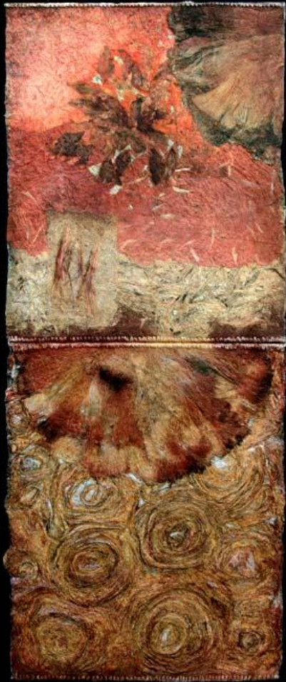
Rouge dragon 5 125 x49 cm