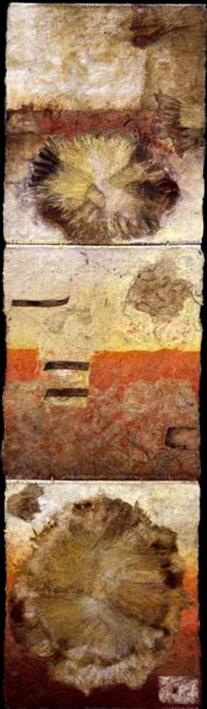
Rouge dragon 2 190 x50 cm