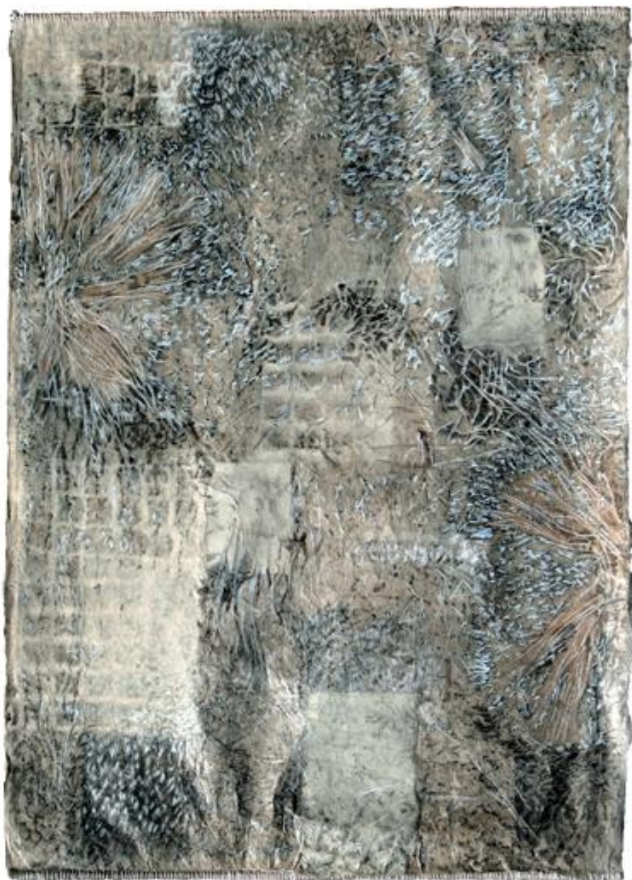
Estampage de dragonnier 100 x70 cm