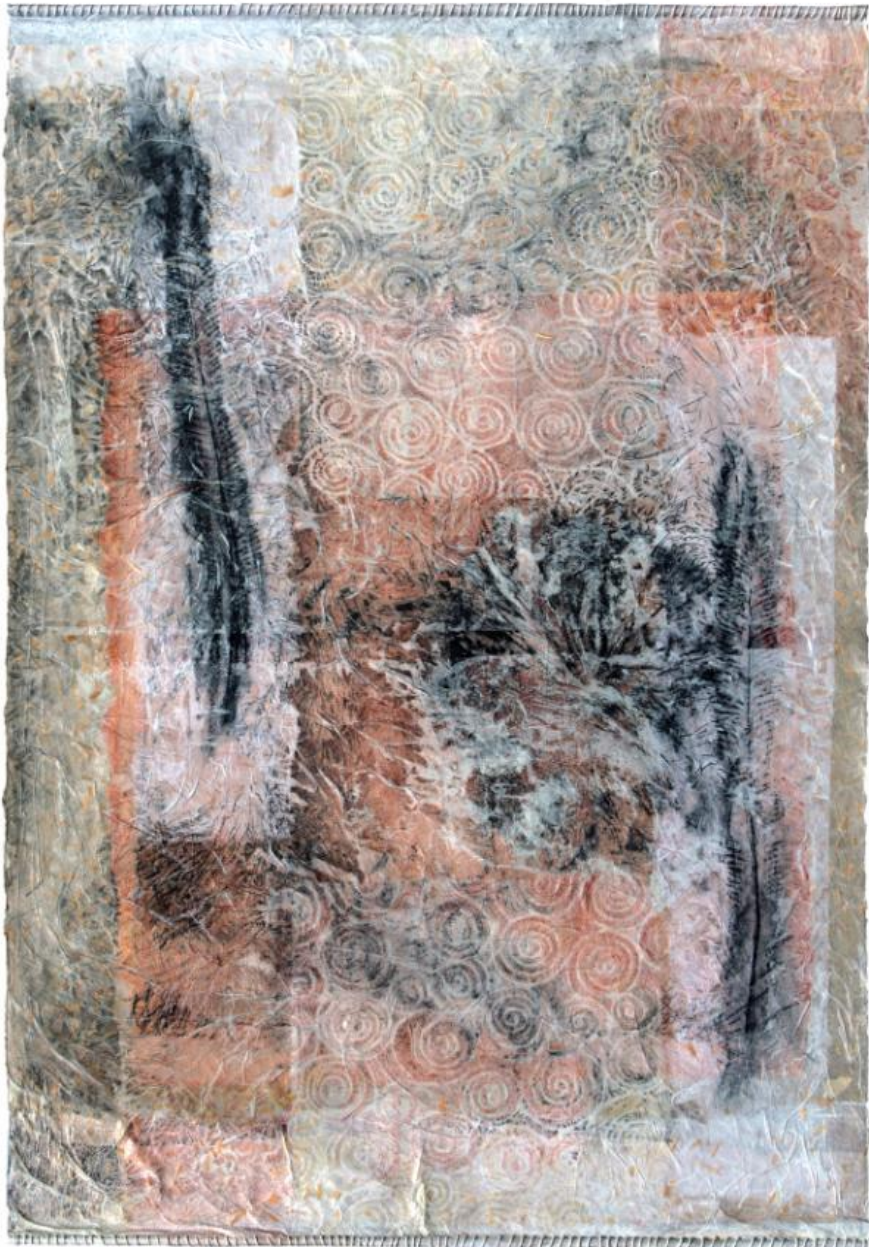
Estampage de dragonnier 100 x 70 cm