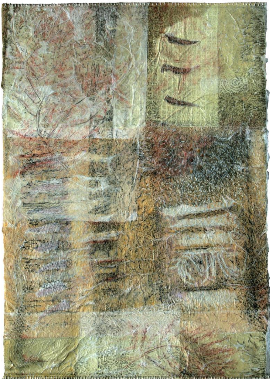
Estampage de dragonnier 100 x70 cm