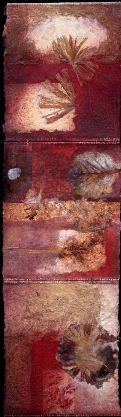
Rouge dragon 4 190 x50 cm